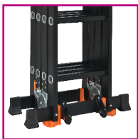
4 ΠΕΛΜΑΤΑ ΣΤΗ ΤΡΑΒΕΡΣΑ ΡΟΔΕΣ ΓΙΑ ΓΡΗΓΟΡΗ ΜΕΤΑΦΟΡΑ