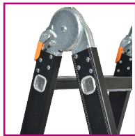
ΕΝΙΣΧΥΜΕΝΗ ΚΛΕΙΔΩΣΗ 42mm