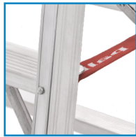
ΙΜΑΝΤΕΣ ΑΣΦΑΛΕΙΑΣ ΣΕ ΟΛΑ ΤΑ ΜΟΝΤΕΛΑ