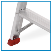
ΜΕΤΑΛΛΙΚΕΣ ΑΝΤΙΡΙΔΕΣ ΓΙΑ ΕΠΙΠΛΕΟΝ ΕΝΙΣΧΥΣΗ ΣΤΟ ΠΑΝΩ ΜΕΡΟΣ ΚΑΙ ΣΤΗ ΒΑΣΗ ΤΗΣ ΣΚΑΛΑΣ