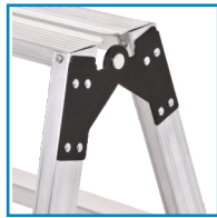
ΥΨΗΛΗΣ ΣΚΛΗΡΟΤΗΤΑΣ ΚΑΤΑΣΚΕΥΗ ΑΛΟΥΜΙΝΙΟΥ ΜΕ ΠΑΧΟΣ 1,7mm