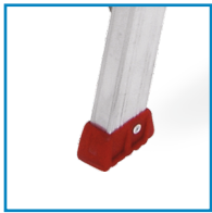
ΛΑΣΤΙΧΕΝΙΑ ΠΕΛΜΑΤΑ ΜΕ ΕΝΩΣΗ ΑΣΦΑΛΕΙΑΣ

Όλα τα μοντέλα είναι συσκευασμένα με αναλυτικές οδηγίες χρήσης Η σκάλα κατασκευάζεται σύμφωνα με τα ευρωπαϊκά πρότυπα EN131 Μέγιστη αντοχή 150kg και εργασιακή εγγύηση καλής λειτουργίας 2 χρόνια Κατασκευάζονται αποκλειστικά από την εταιρεία μας