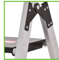
ΥΨΗΛΗΣ ΣΚΛΗΡΟΤΗΤΑΣ ΚΑΤΑΣΚΕΥΗ ΑΛΟΥΜΙΝΙΟΥ ΜΕ ΠΑΧΟΣ 1,7MM