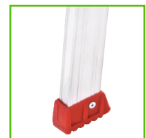
ΛΑΣΤΙΧΕΝΙΑ ΠΕΛΑΜΑΤΑ ΜΕ ΕΝΩΣΗ ΑΣΦΑΛΕΙΑΣ