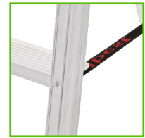
ΜΕ ΙΜΑΝΤΕΣ ΓΙΑ ΚΑΛΥΤΕΡΗ ΑΣΦΑΛΕΙΑ