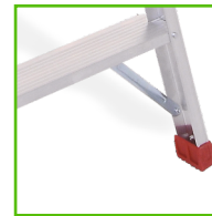
ΜΕΤΑΛΛΙΚΕΣ ΑΝΤΙΡΙΔΕΣ ΓΙΑ ΕΠΙΠΛΕΟΝ ΕΝΙΣΧΥΣΗ ΣΤΟ ΠΑΝΩ ΜΕΡΟΣ ΚΑΙ ΣΤΗ ΒΑΣΗ ΤΗΣ ΣΚΑΛΑΣ