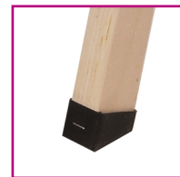
ΑΝΤΙΟΛΙΣΘΗΤΙΚΑ ΠΛΑΣΤΙΚΑ ΠΕΛΜΑΤΑ